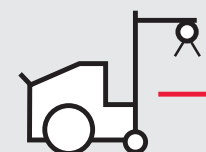
Appareil de radiographie mobile