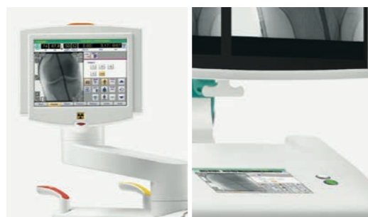
Mit SmartArchive ist via Vision Center der schnelle Zugriff auf die aktuellen Patientendaten möglich.