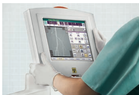
Ziehm SmartEye ermöglicht eine Live-Darstellung der Durchleuchtung auf dem Vision Center.