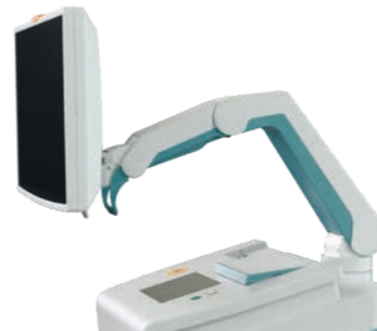
Vielseitige Anzeigeeoptionen für maximale Flexibilität im OP (optional für die ganze Vision-Familie).