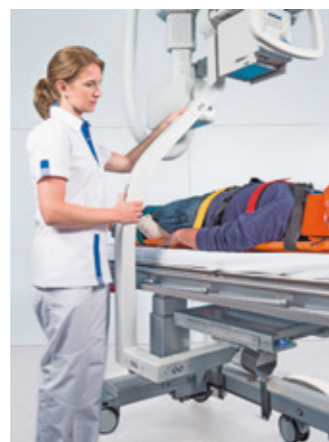
Trauma DR Plus mit Notfallliege

Das Trauma DR Plus kann schnell und einfach um den Patienten herum positioniert werden und stört den Ablauf im Schockraum nicht. Durch die stetige Zentrierung von Röhre und Detektor kann jederzeit umgehend eine Aufnahme erfolgen. Die integrierte Messkammer sorgt dabei für dosisoptimierte Aufnahmen, unabhängig von der Patientenunterlage.