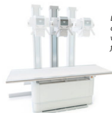
Die Säule kann auf einer Länge von 2.5 m verfahren werden

Das Covator System wird überall dort eingesetzt, wo die Flexibilität eines Röntgenraumes gefordert wird, jedoch kein Deckenstativ montiert werden kann. Die Kombination von Patiententisch mit schwimmender Tischplatte, verfahrbarem Röhrenstativ und Wandstativ ermöglicht sämtliche Aufnahmen.