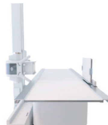
Einfache Positionierung für laterale Aufnahmen über die gesamte Länge