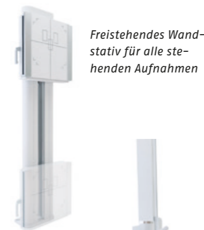
Freistehendes Wandstativ für alle stehenden Aufnahmen