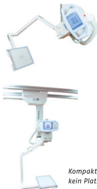
Einfach schwenkbar in alle Richtungen