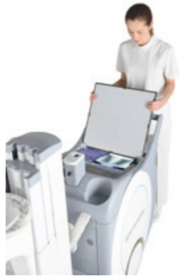
Praktische Detektorhalterung und Ablageflächen.