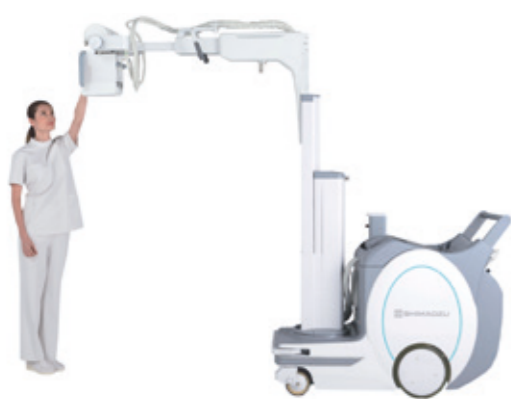
Versenkbare Säule, grosser Hub, manuell, leichtgängig, ausbalanciert (ohne Gewichte und Federn).