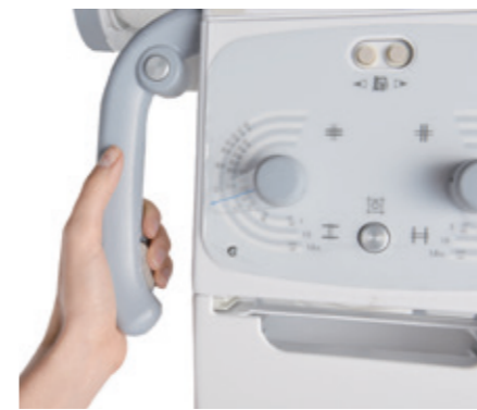
Einknopfbedienung und Inch-Mover.