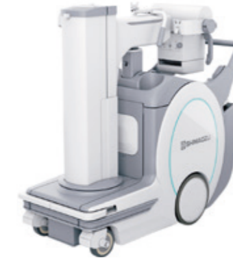
Die kompakte Bauweise und die versenkbare Säule unterstützen die freie Sicht beim Manövrieren.