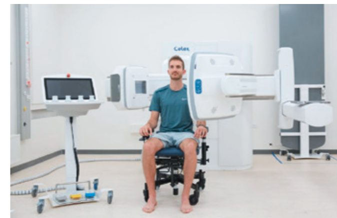
Dank der entfernbarer Tischplatte können auch sitzende Patienten ergonomisch untersucht werden.