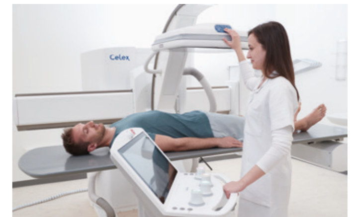
Steuerung über das Smartpanel am Detektorgehäuse oder mit der InControl-Konsole im Raum sowie vom Bedienraum her.