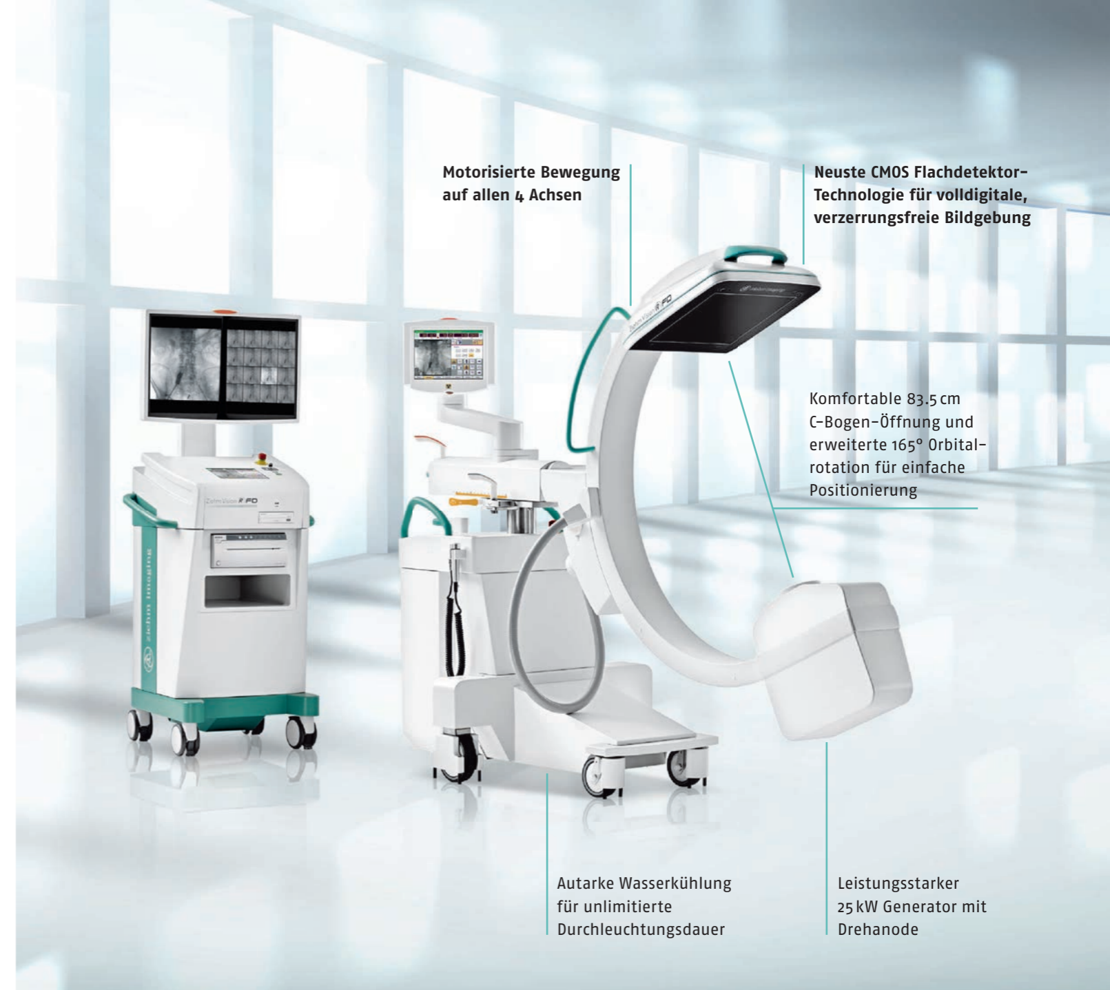
Distance Control, kontaktfreier Kollisionsschutz

Motorisierte Bewegung auf allen 4 Achsen