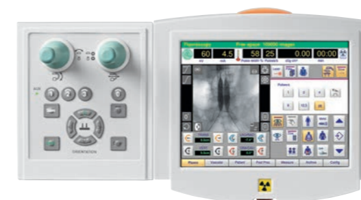
Position Control Center und Remote Vision Center ermöglichen volle Kontrolle am OP-Tisch.

Leistungsstarker 25 kW Generator mit Drehanode