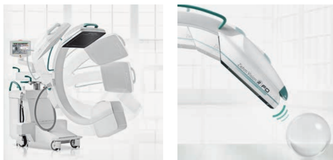
Memoryfunktion für 3 Positionen