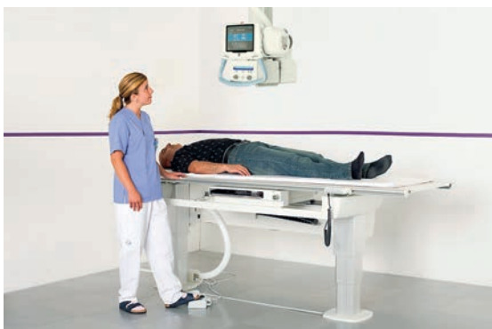
Der lange Vertikalhub ermöglicht angenehme Wandaufnahmen bis zum Boden. Die hohe Arbeitshöhe am Tisch schont den Rücken.