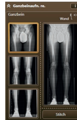
Das Stitching (Wand oder Tisch) ist komplett in die Bedienoberfläche integriert und automatisiert. Das Röntgensystem unterstützt dabei das Einrichten graphisch, berechnet die benötigte Anzahl Bilder selbstständig und verfährt die gesamte Aufnahme automatisch.